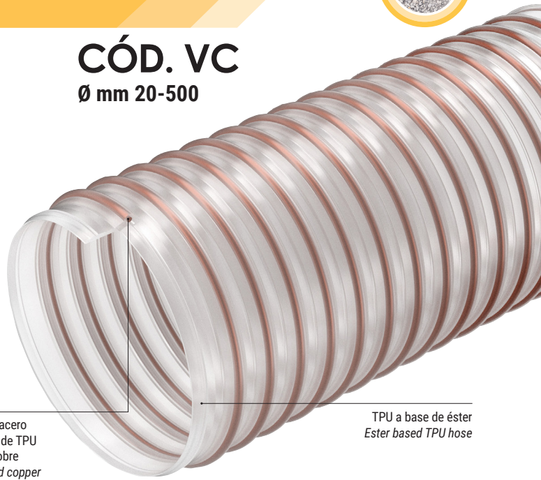
Espiral de acero recubierta de TPU de color cobre TPU coated copper colored steel spiral