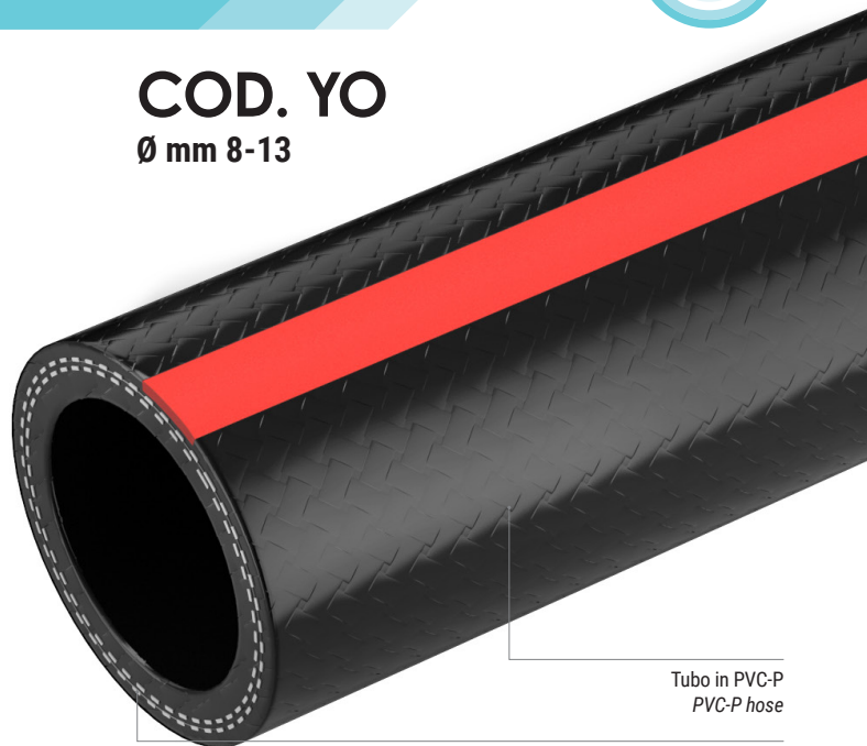
Tubo in PVC-P PVC-P hose