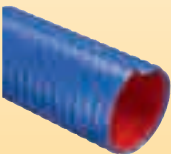
URANO HD SUPER (cod. UH) p.36

ARTICOLI DELLA STESSA SERIE ITEMS IN THE SAME SERIES